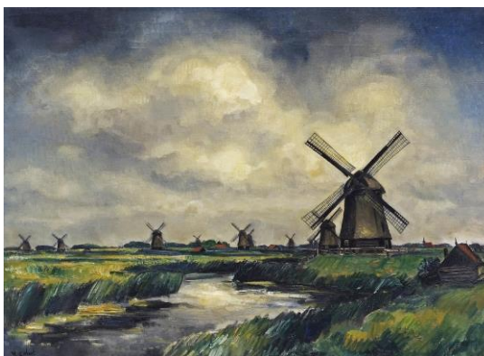
Afbeelding 2: Arnout Colnot, Poldermolens in de Schermer, 1931. Hoogheemraadschap Hollands Noorderkwartier