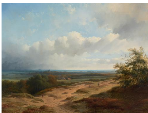
Afbeelding 1: George ten Berge, Gezicht op de duinen bij Bergen, 1856. Stedelijk Museum Alkmaar