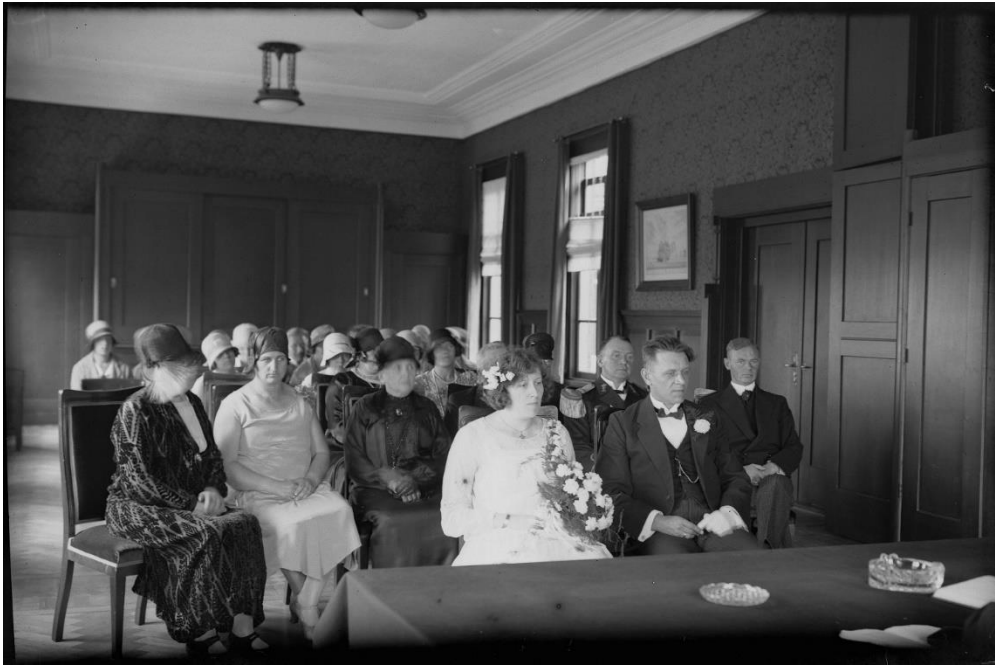
Een huwelijk in de trouwzaal van het gemeentehuis in Den Helder, circa 1930.