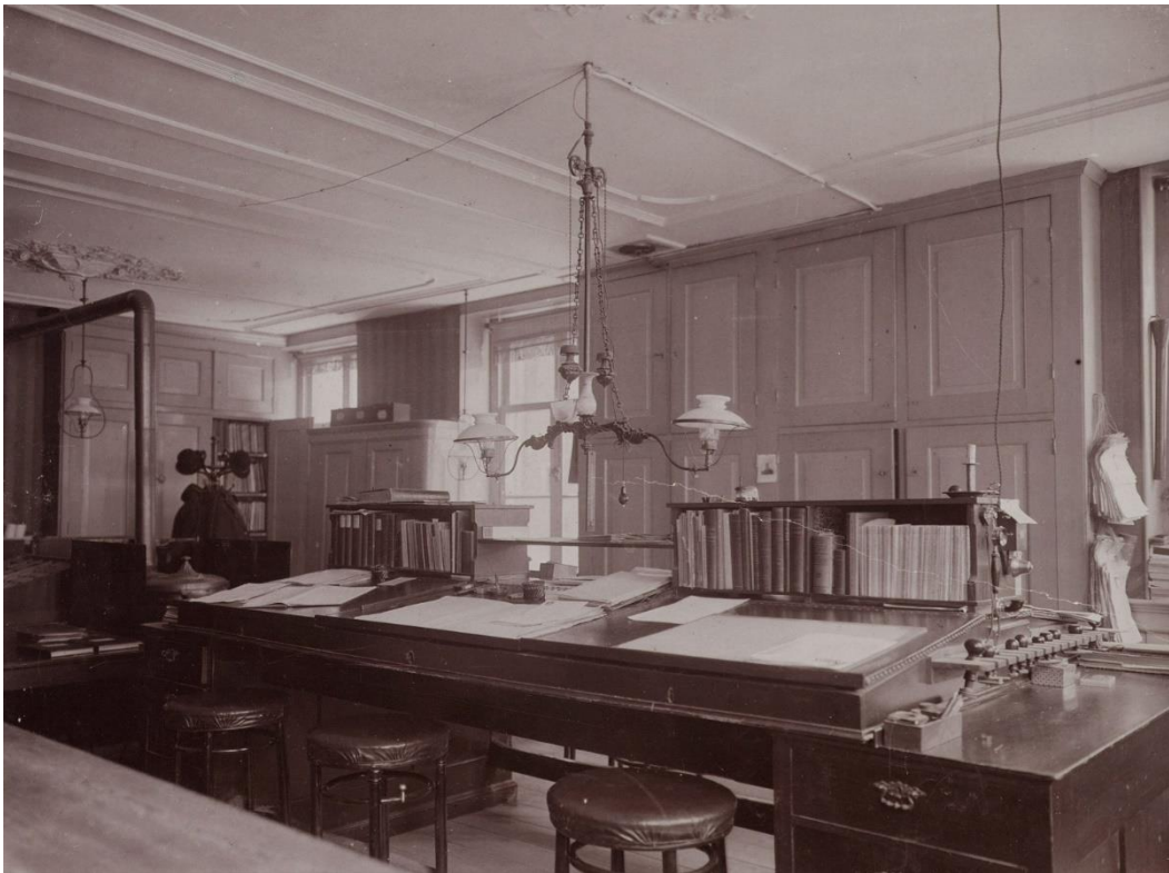
Kamer van de burgerlijke stand in het stadhuis van Alkmaar, 1912.