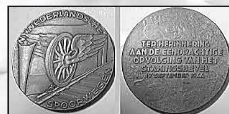
Afb. Bronzen penning

Op 17 september 1946 werd, ter gelegenheid van de tweede verjaardag van de staking aan het voltallig personeel van de NS een leg- en/of draagpenning uitgereikt. De legpenning met een middellijn van 50 mm heeft aan de voorzijde een gevleugeld wiel waarvoor op de rails een remstof is gelegd. Op de achterzijde staat: Ter herinnering aan de eendrachtige opvolging van het stakingsbevel 17 september 1944. De draagpenning heeft een middellijn van 20 mm met aan de bovenkant een draagoog. De bronzen penning werd aan de stakers zelf uitgereikt, de zilveren penning met de tekst: In dankbare herinnering aan uw steun en medewerking bij de spoorwegstaking 17 september 1944 - 5 mei 1945, kre-