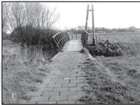
Het tweede bruggetje van het Daalmeerpapad gaat over een smalle sloot, de Kromme Heining genoemd. Dit was de

Nadat we de eerste brug van het Daalmeerpapad, over de Veert, zijn overgegaan passeren we vijf huizen die aan de zuidzijde van het pad zijn gebouwd. De huizen hier dateren tussen 1893 en 1916. Aan de noordzijde staat een pompgebouw uit de vijftiger jaren. Even verderop staat een nieuw pand dat in 2004 is opgetrokken. Vlak voor het tweede bruggetje staat het gebouw van de rioolzuivering. Dit gebouw is ook in de jaren vijftig gebouwd. In de volksmond werd dit 'Het Stinkemaal' genoemd. De installatie is gesloopt tijdens de ruilverkaveling. Het gebouw van de rioolzuivering was gebouwd op de 'Breggegroet'. In de zestiger jaren was alle grond wat noordelijk gelegen was tussen Daalmeerpapad en Zomersloot van de eerste tot aan de tweede brug het eigendom van de gemeente Sint Pancras.