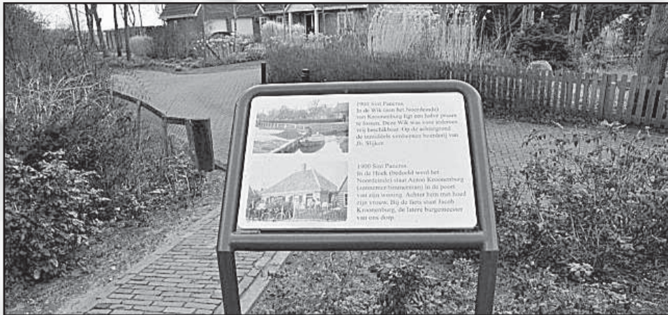
Wik van Kroonenburg, geplaatst aan het Noordeinde

Bij het verschijnen van deze krant staat een drietal informatielessenaars in ons dorp, binnens afzienbare tijd wordt een vierde geplaatst bij de Spoorbrug