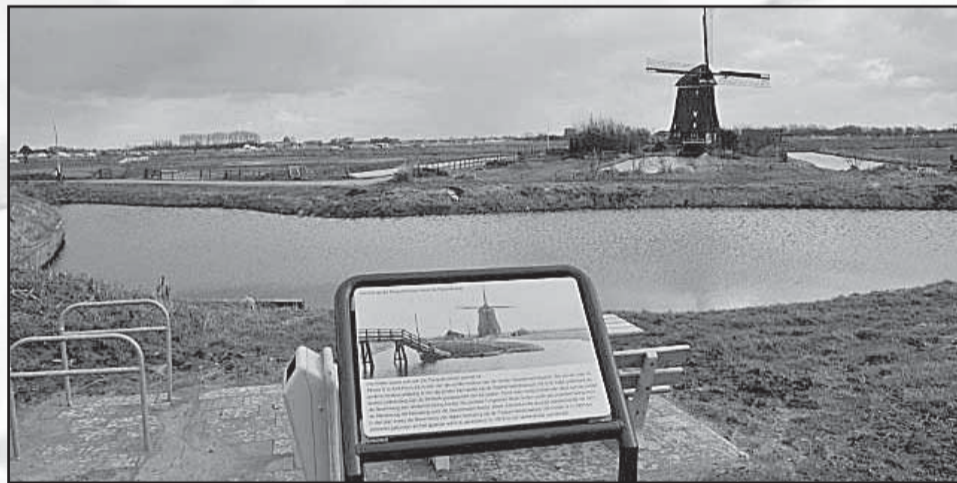
Molen van Kriek aan de Dijkstalweg