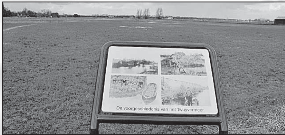
Bij het Twuyvermeer (de Paddenpoel) aan de Spanjaardsdam