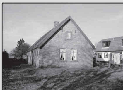
Benedenweg 212, huis gebroeders Visser

Ons dorp verandert zo toch wel heel snel, realiseren we ons dat wel!