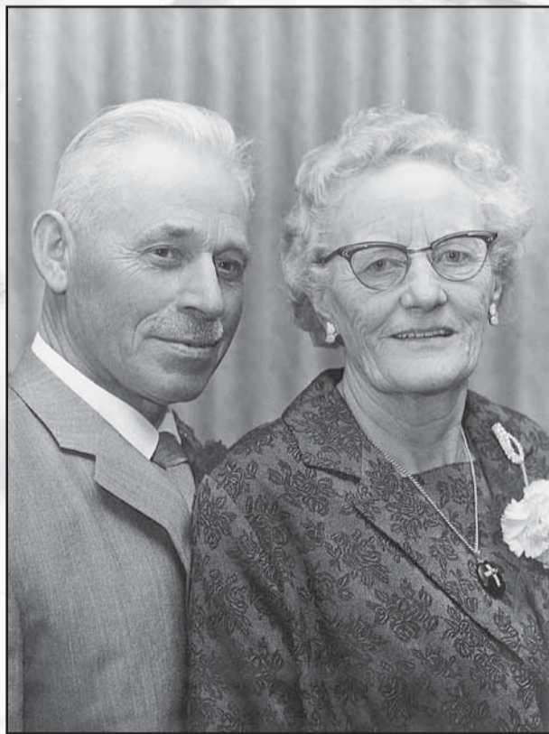
1967, 40-jarig huwelijksjubileum