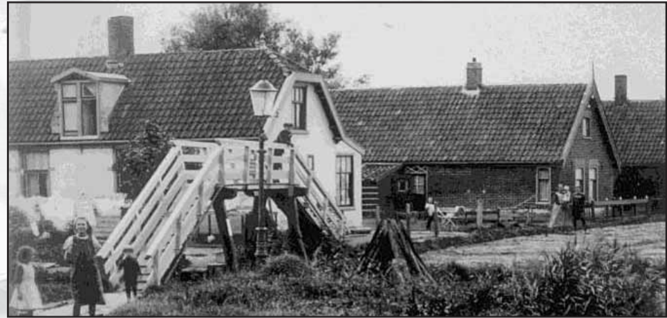
De oude voetbrug over de Veert van rond 1900

Wie kent ze niet, de zeven bruggetjes van het Daalmeerpadd. Hoeveel keer bent u er wel niet overheen gefietst of onderdoor gevaren. Kees Bakker liet ze tussen 2005 en 2008 in 'De Gouden Engel' allemaal nog een keer de revue passeren. Hij begon met de brug over de Veert.