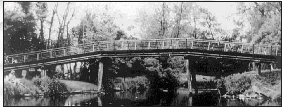
De brug over de Veert van na 1930. Deze brug deed dienst tot aan de ruilverkaveling van de jaren '70

De eerste vermelding van een voetpad naar de Daalmeer dateert van 1574. Bij een verpachting van percelen moesten de pachters toelaten dat er een voetpad van 5 voet breed over de noordkant van hun land naar de Daalmeer zou worden gemaakt. Over de Veert lag in die tijd een vlonder (een brede plank). Op kaarten van 1858 was deze situatie nog steeds zo. Voor 1900 kwam er een voetbrug over de Veert en werden er huizen gebouwd aan het landpad op de 'Breggegroet' (de brugakker). Het voetpad werd indertijd ook wel het Bregpad genoemd. Op de foto is een lantaarn te zien, deze is in 1895 geplaatst. Oorspronkelijk brandde deze op petroleum, maar is in 1916 omgebouwd tot gaslantaarn