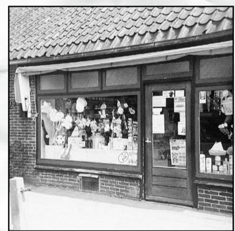
De winkel aan de Bovenweg.